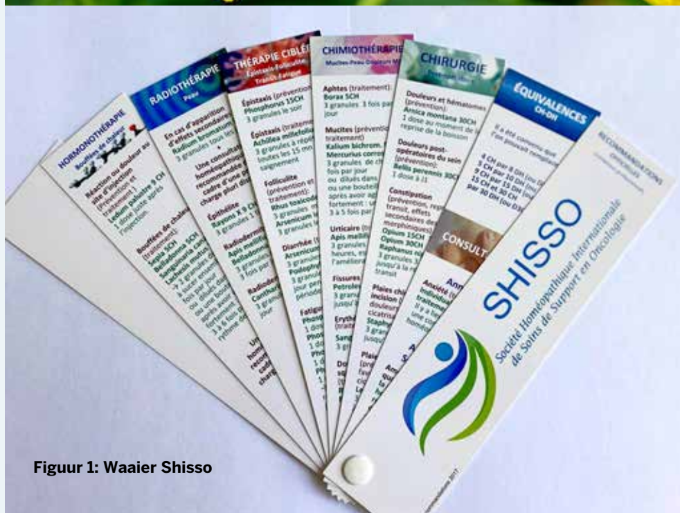
Figuur 1: Waaier Shisso

De positieve resultaten vormen een stimulans om homeopathie in een multidisciplinair behandelplan voor kanker te integreren.